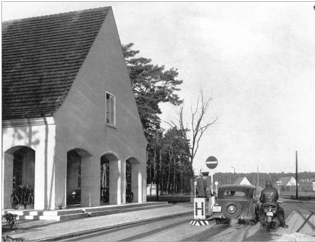
Fahrzeugkontrolle an der Hauptwache